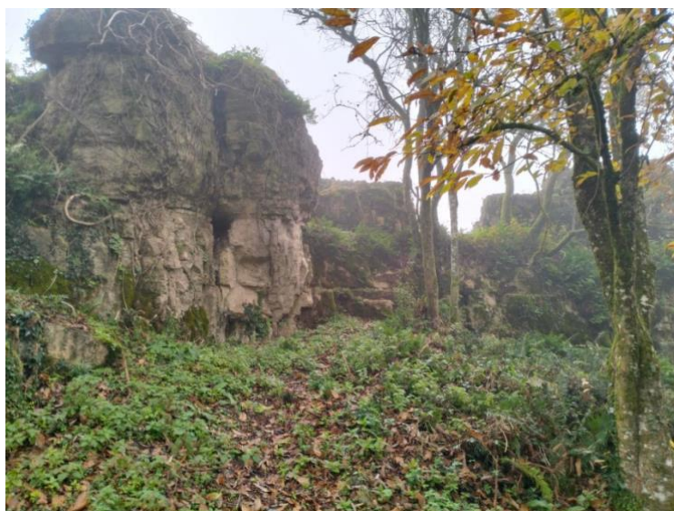
PENA DO EIRADO

Quedamos na praza do concello ás 10:00 h. Saimos en coches ata Pena, para viistar as Penas do Eirado e voltamos a Castro Verde por Bolaño. Comunicade asistencia, por saber o número de persoas, antes do día 7 de xaneiro.