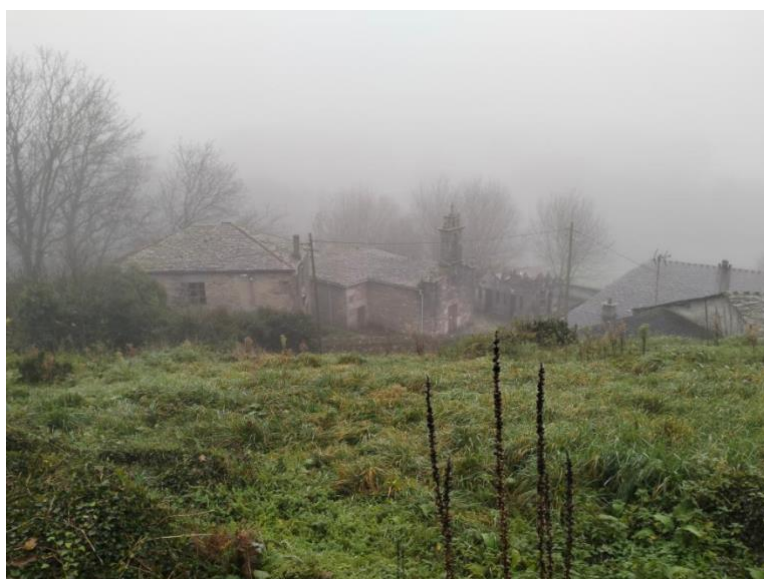
IGREXA DE PENA