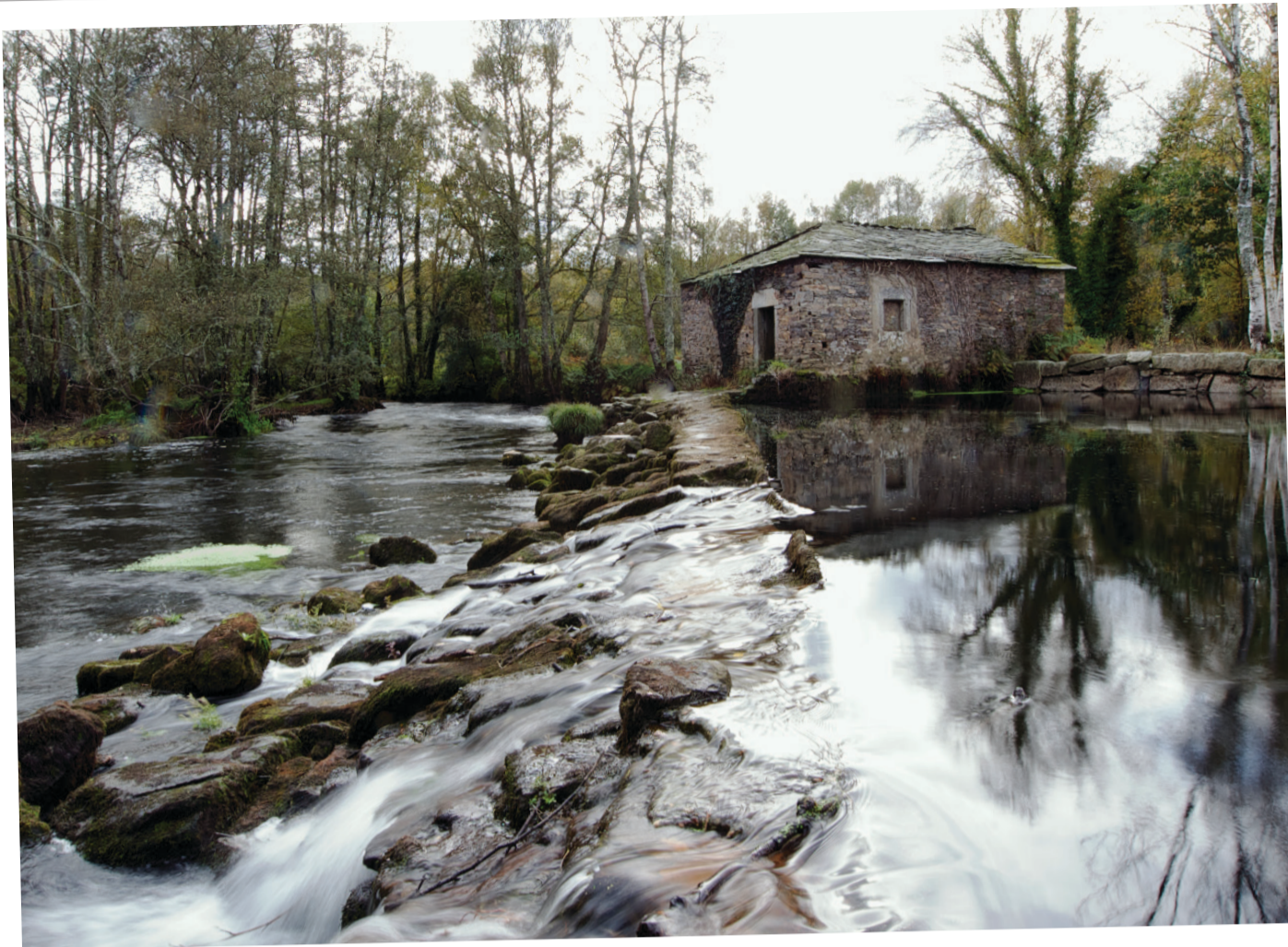
Muíño na Reserva da Biosfera "Terras do Miño".