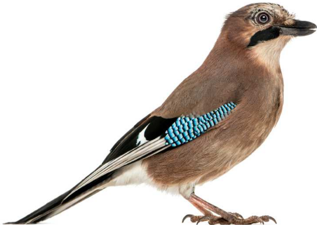
Gaio común. ( Garrulus glandarius )