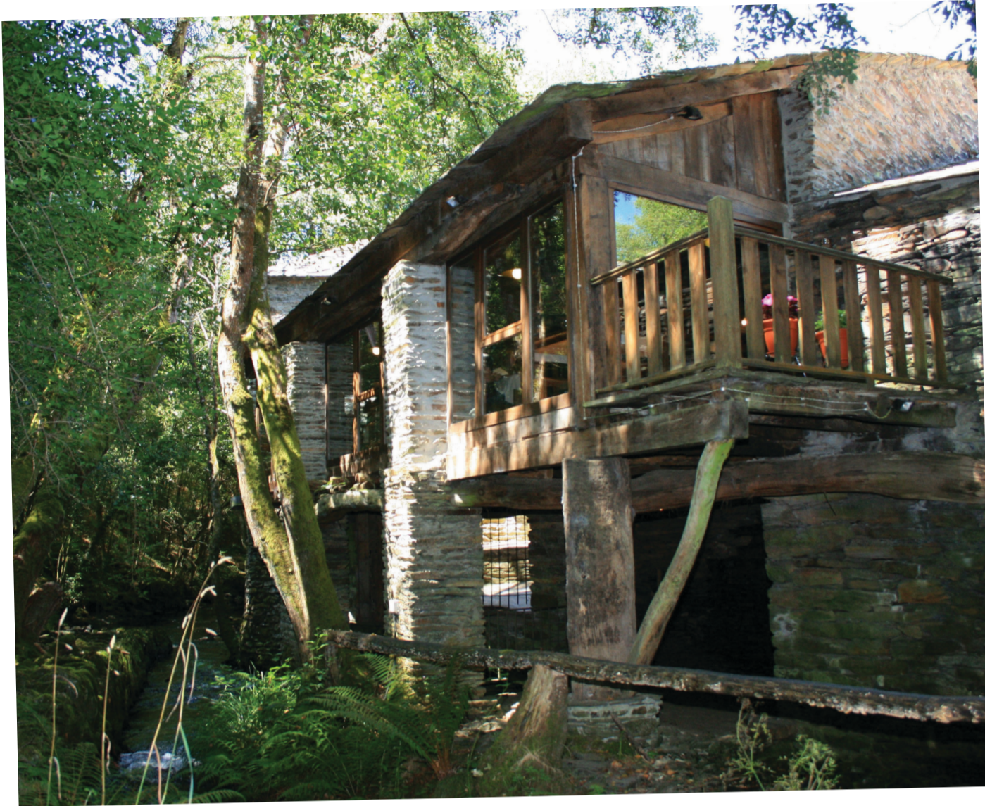
Mazo de Santa Comba.