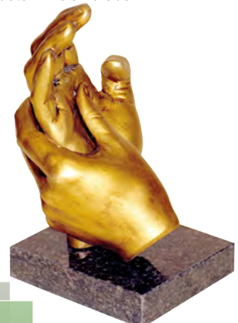
Galardón elaborado por Cesar Lombera

6.- A entrega dos premios realizarase nun acto público que terá lugar, segundo o previsto, en decembro do 2015, no lugar e día que determine o Xurado.