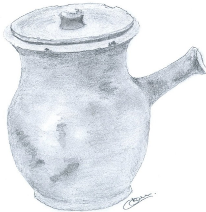
Chocolateira con testo