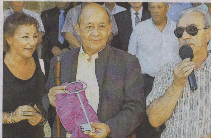
El ministro francés y su esposa, junto con el alcalde.