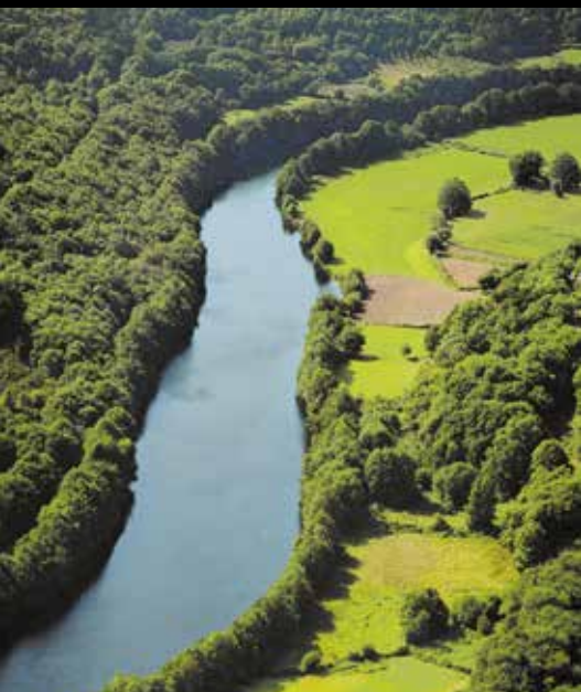
Reserva da Biosfera Terras do Miño