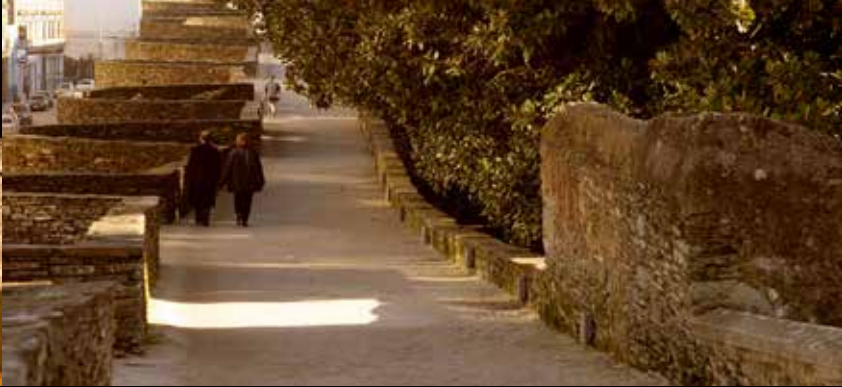
Muralla romana de Lugo (declarada Patrimonio da Humanidade pola UNESCO o 30 de novembro do ano 2000)