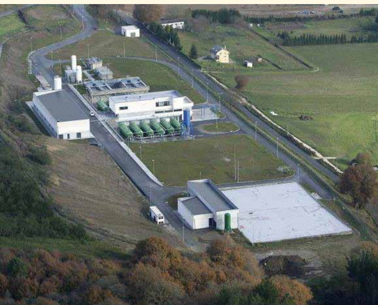
ETAP municipal de Lugo