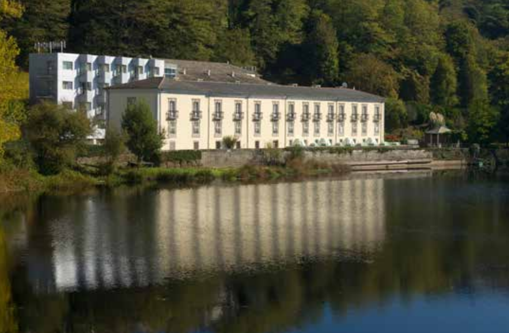
Balneario Termas Romanas de Lugo