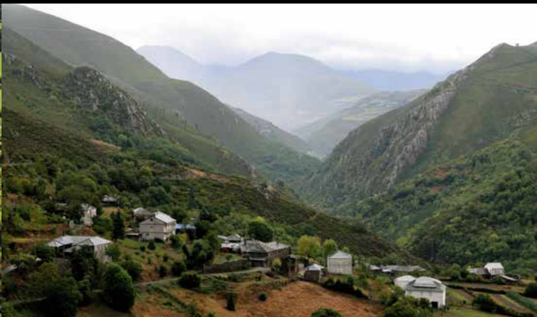
Reserva da Biosfera Os Ancares Lucenses