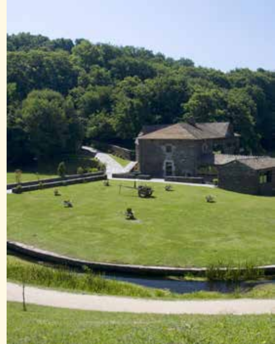
Centro de Interpretación da Reserva da Biosfera Terras do Miño