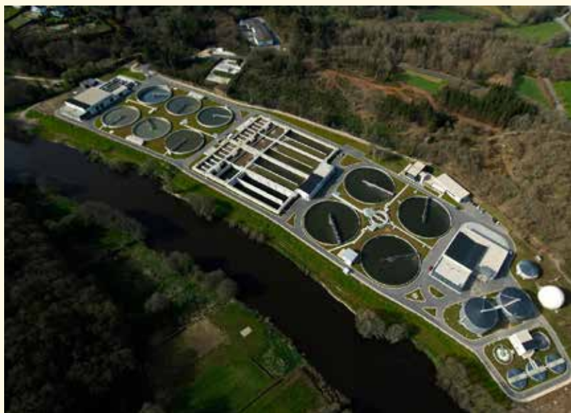
EDAR municipal de Lugo